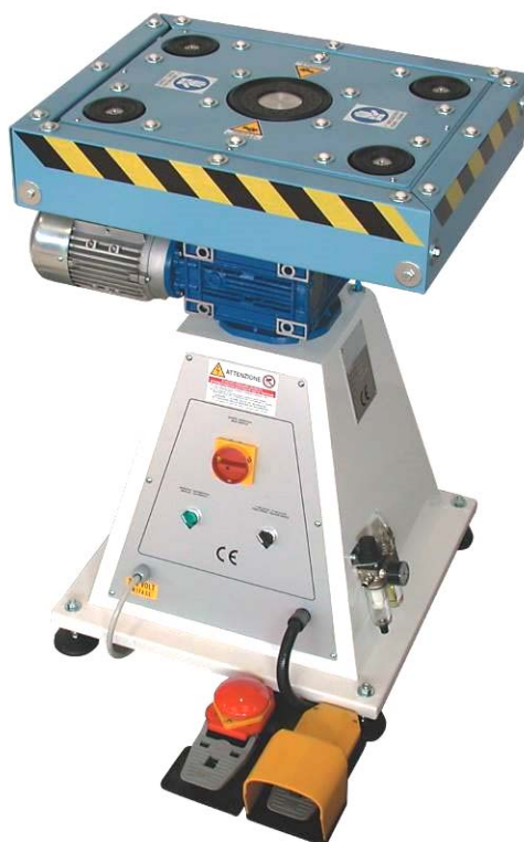
TABLE TOURNANTE A CINQ CUP